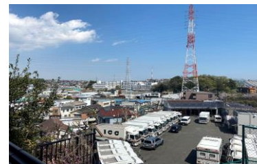
【現地バルコニー眺望】