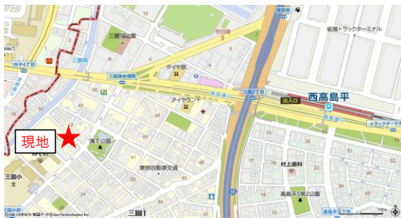
【図面と現況が異なる場合は現況を優先とします】

全室採光南東角部屋の開放的なお部屋！陽当たり・通風良好！ 都営三田線始発駅の西高島平まで徒歩8分の好立地！