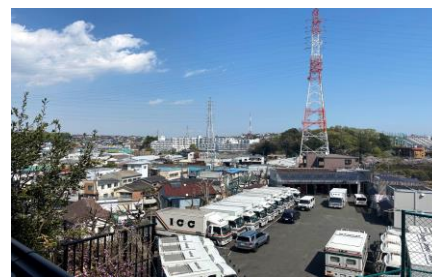
【現地バルコニー眺望】