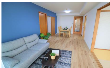
【リビングダイニング】