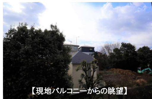
【現地バルコニーからの眺望】