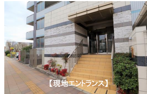
【現地エントランス】