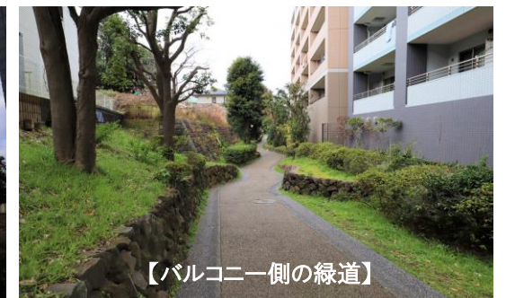
【バルコニー側の緑道】