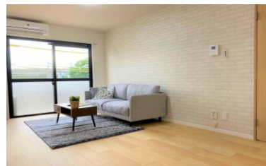
【リビングダイニング】