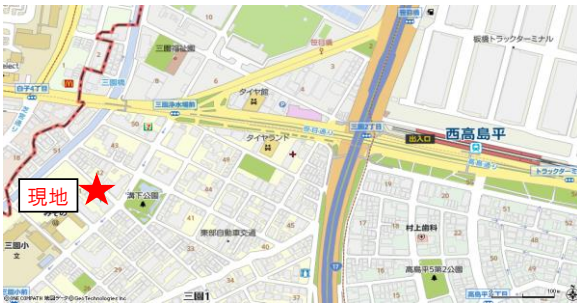
【図面と現況が異なる場合は現況を優先とします】

全室採光南東角部屋の開放的なお部屋！陽当たり・通風良好！ 都営三田線始発駅の西高島平まで徒歩8分の好立地！