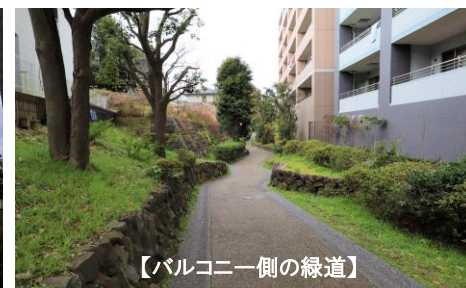
【バルコニー側の緑道】

三ツ沢公園が徒歩圏内！ 288,724㎡の広大な敷地を擁する 緑溢れる三ツ沢公園。 三ツ沢球技場ではFC横浜の試合や 各スポーツイベントがおこなわれます。