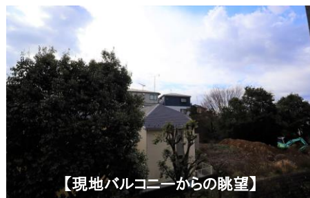
【現地バルコニーからの眺望】