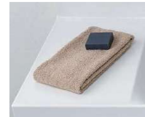
カウンターは仮置きスペースにピッタリ