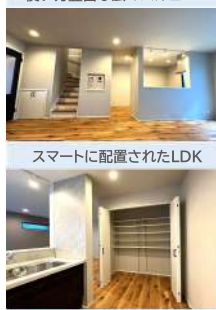
スマートに配置されたLDK