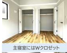
主寝室にはWクローゼット