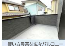
使い方豊富な広々バルコニー