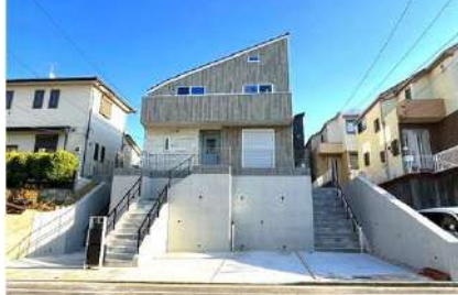
道路から見た3号棟全景。3号棟は道路からの距離も十分