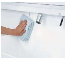
一体成形カウンターでお手入れ簡単