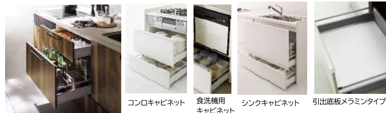
コンロキャビネット

加熱・切る・洗うなどの作業別に必要なアイテムは、キッチンのスペース別に分類。ムダなスペース&ムダな動きが軽減されて、快適なキッチンが実現します。