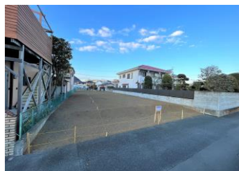
南道路から見た現地