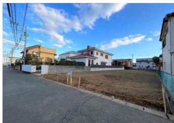
北道路から見た現地